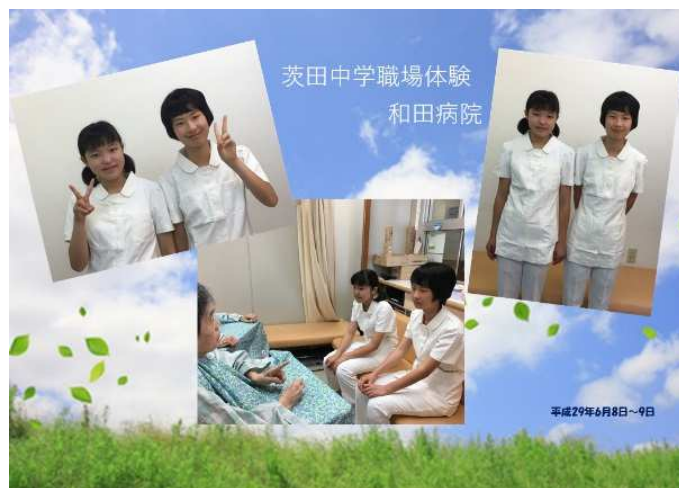
看護師体験のプレゼント