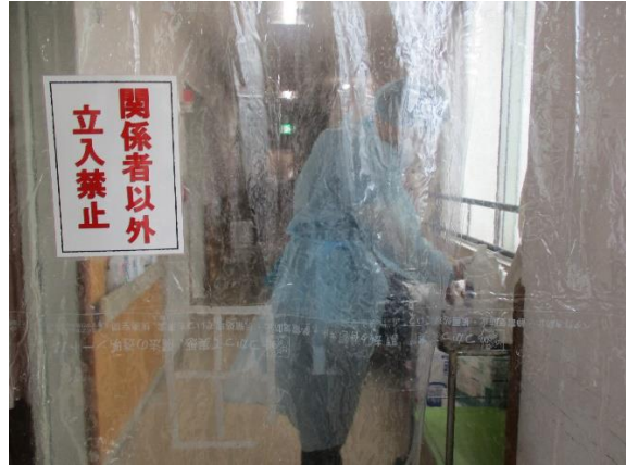
感染エリア内対策 （ビニールカーテン）