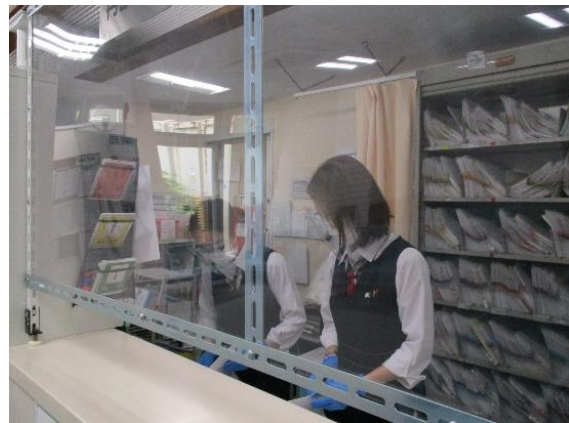
受付感染対策 （アクリル板）