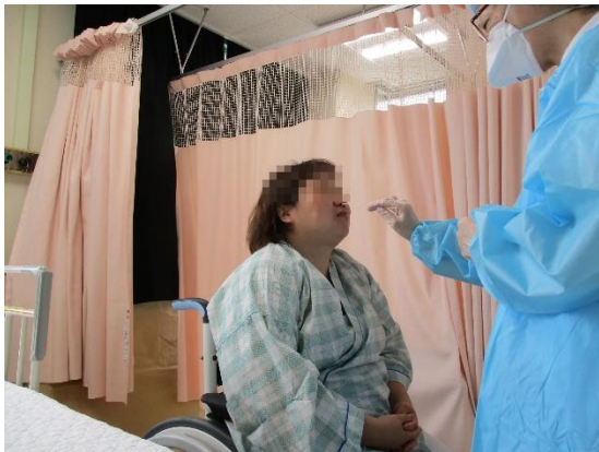
入院患者さん （鼻咽頭 PCR 検査）