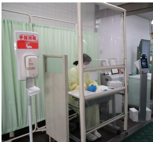
← 正面入り口感染対策 （検温・手指消毒）