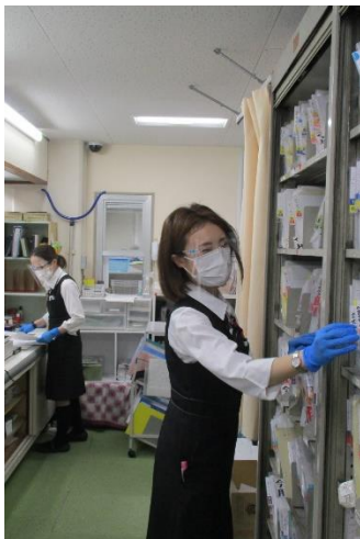
受付感染対策 （フェイスガード・ビニール手袋）