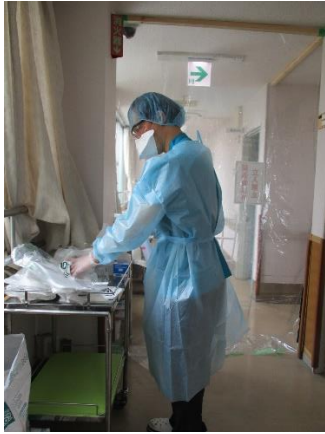
病棟看護師感染対策（防護服・キャップ・ N95 マスク・ビニール手袋・ゴーグル）